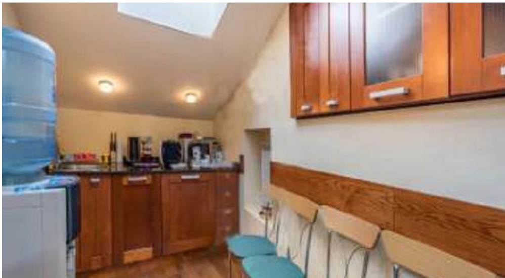
цоколь - 146 кв.м